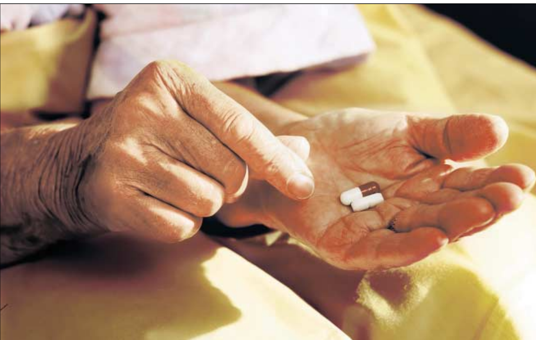
Ohne Medikamente nicht ins Bett. Besonders ältere Frauen sind von Schlaf- und Beruhigungsmitteln abhängig.